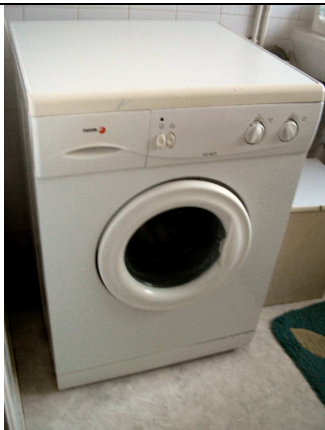
LA MACHINE A LAVER